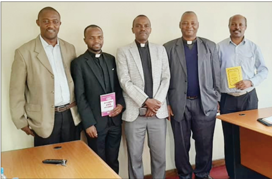
Baadhi ya wanakamati wa kitabu cha nyumba kwa nyumba wakiwa katika picha ya pamoja mara baada ya kumaliza maandalizi ya kitabu hicho.

Kitabu cha nyumba kwa nyumba hutoka kila mwaka, na zaidi ya nakala 50,000 husambazwa kwenye Dayosisi zote za KKKT.