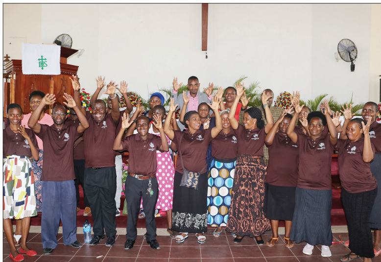
walemavu wa kutokusikia (waliovaa tisheti) wakifurahia jambo mara baada ya kumalizika kwa Ibada ya viziwi katika Usharika wa Salasala DMP.

Maisha Endelevu na Uwezeshaji linasisitiza kuwa huduma ya Ukalimani kwa watu wenye ulemavu wa kutokusikia liwe ni jambo la kuigwa na vyombo vyote vinavyotoa huduma katika Kanisa na jamii kwa ujumla.