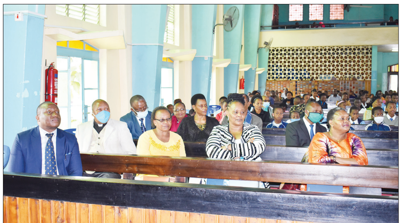
Baadhi ya wanakamati ambao pia waliwahi kusoma Shule ya Seminari ndogo ya Kilutheri Morogoro wakifuatilia ibada ya Uzinduzi wa kuichangia shule hiyo.