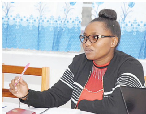
Rizikiaeel Kileo mmoja wa wasilisha mada katika kikao kilichofanyika kwa njia ya mtandao.