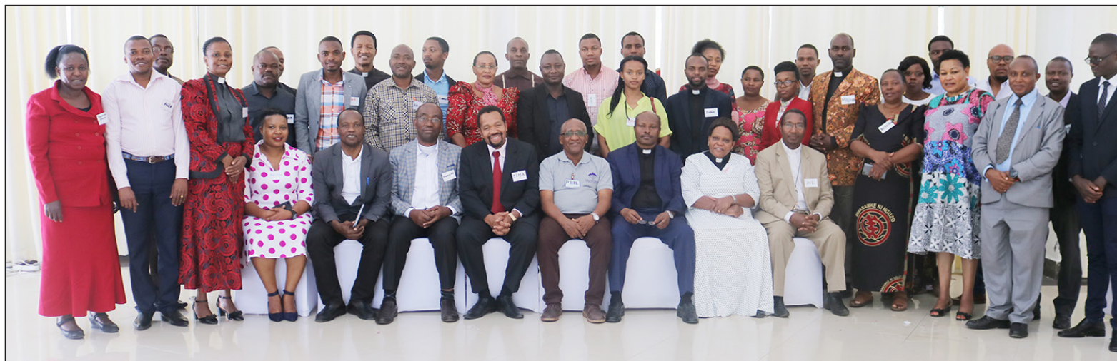
Watenda kazi wa Ofisi Kuu na vituo vya Umoja KKKT wakiwa kwenye picha ya pamoja mara baada ya kumalizika kwa mafunzo ya kuongeza katika utendaji kazi.