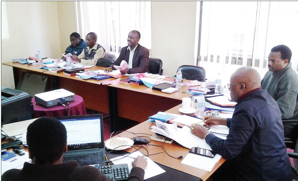
Kamati ya Kalenda KKKT ikijadili jambo wakati wa maandalizi ya kalenda ya mwaka 2021.