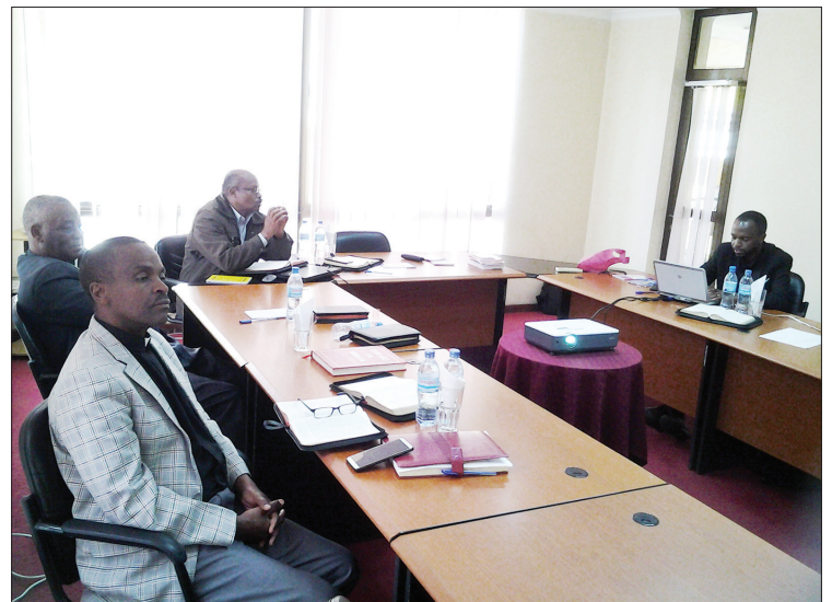
Baadhi ya wanakamati wa Kitabu cha Nyumba kwa Nyumba wakijadili jambo wakati wa maandalizi ya Kitabu hicho.

Kitabu cha nyumba kwa nyumba hutoka kila mwaka, na zaidi ya nakala 50,000 husambazwa kwenye Dayosisi zote za KKKT.