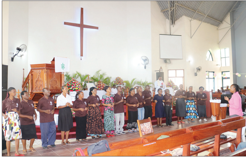
walemavu wa kutokusikia wakiimba kwa kutumia lugha ya Alama wakati wa Ibada ya Maadhimisho ya viziwi iliyofanyika katika Usharika wa Salasala DMP.