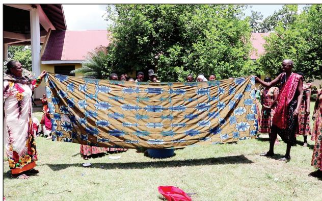
wanavikundi wa ujasiriamali wanaowezeshwa na KKKT kupitia Programu ya Maisha Endelevu na uwezeshaji wakionyesha mfano wa kazi wanazofanya kwa wageni wao kutoka Dodoma.