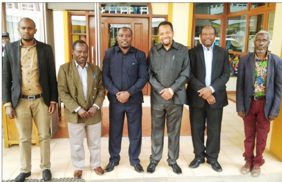
Baadhi ya wajumbe wa bodi ya Ukaguzi KKKT wakiwa kwenye picha ya pamoja mara baada ya kumalizika kwa vikao vya bodi hiyo mjini Arusha..

Ukaguzi unafaida kubwa ya kutunza nidhamu, kuweka miongozo sahihi ya kiukaguzi, kuboresha utendaji na inaleta ari ya kiutendaji katika Kanisa”