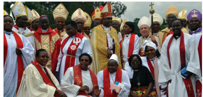
Viongozi wa Makanisa, Wachungaji na washiriki wengine waliokutana Moshi mwaka 2015 kuadhimisha miaka 60 ya Mkutano wa Marangu kama sehemu ya maandalizi ya mkutano wa 12 wa FMKD.

Mkutano Mkuu wa 10 wa Fungamano la Makanisa ya Kilutheri Duniani (FMKD) utafanyika 10 - 16 Mei, 2017 Windhoek, Namibia. Mada Kuu: ‘Nimekombolewa kwa Neema ya Mungu’. Mada ndogo chini ya Neno kuu ni: Wokovu si wa Kuunza; Binadamu si wa Kuuzwa na Uumbaji si wa Kuuzwa”.