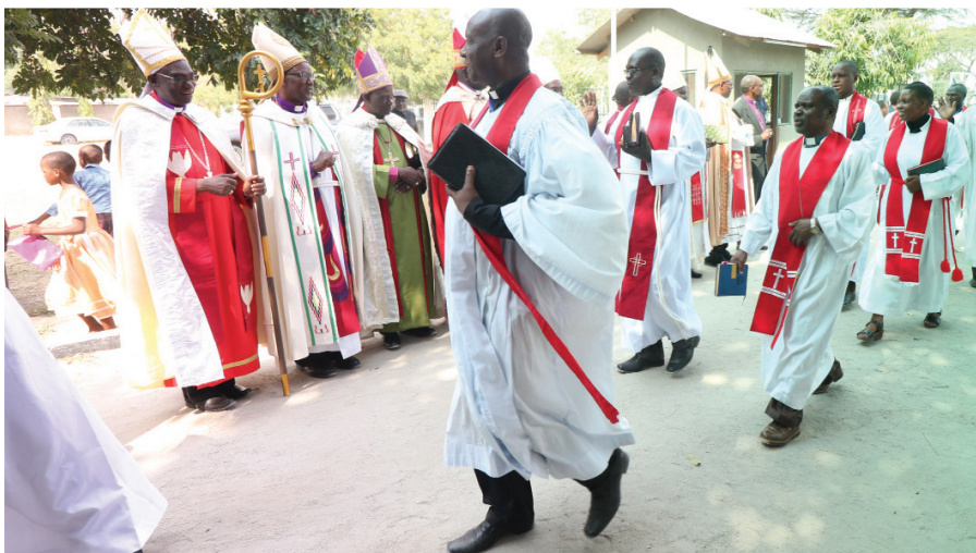
Wajumbe wapatao 1,500 walihudhuria Mkutano wa Wachungaji wa KKKT Septemba, 2016.

Washiriki hao wapatao 1,500 wamekubaliana kuomba umoja na kutoa ushirikiano katika kukusanya na kuwashilisha kwa wakati michango ya hali na mali ili kutunza kazi za pamoja.