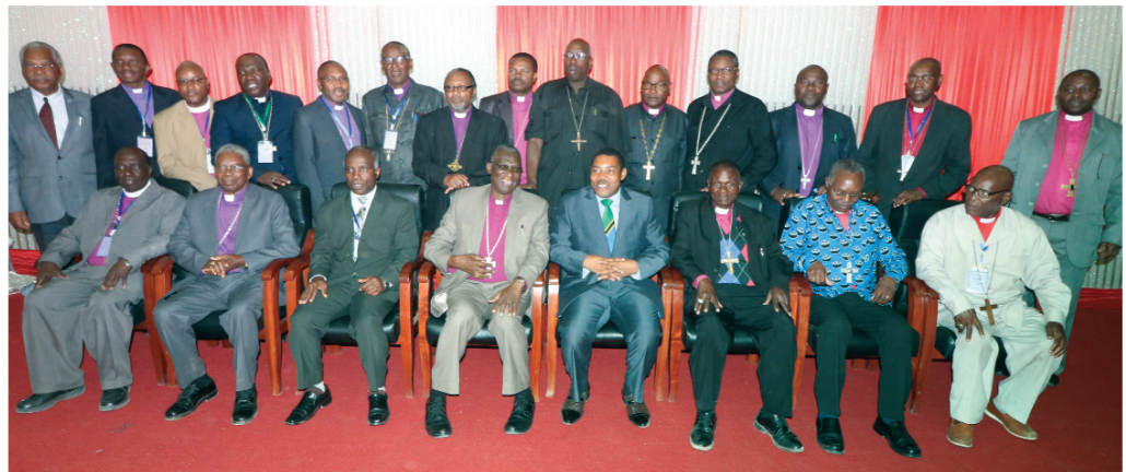
Baadhii ya viongozi wa KKKT wakiwa na Waziri wa Mambo ya Ndani, Mhe. Mwigulu Nchemba, aliyefika UDOM kuusalimu Mkutano wa Wachungaji wa KKKT Septemba 2016 ambapo aliwasilisha mchango wake wa hiari.