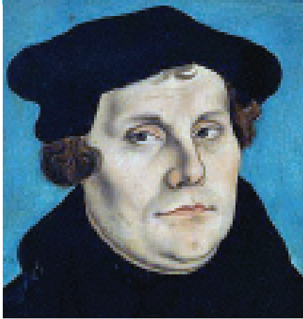
Dkt. Martin Luther.