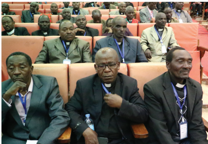
Wakristo wakihubiriwa Neno kwa usahihi wake ndipo watakapotambua wokovu wao unaopatikana kwa imani.

Soma Mada yote kutoka tovuti ya KKKT: www.elct.org/documents/2016.11.Mada-kuhusu-Umoja-wa-Kanisa.pdf