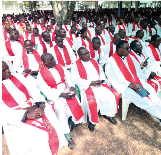
Ibada ni njia moja inayoweza utambulisho wetu kwa wazi sana.