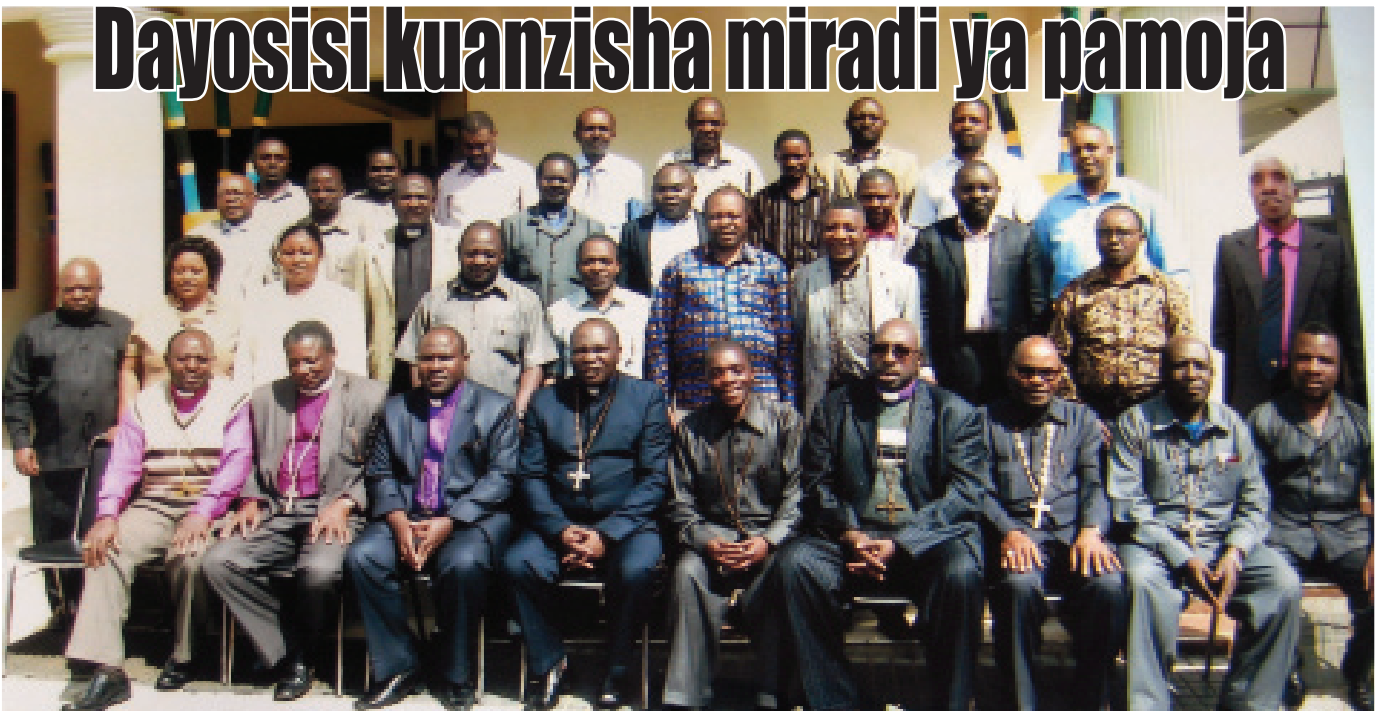
Picha ya pamoja ya viongozi wa Dayosisi na washiriki wengine toka Ukanda wa Kusini (Southern Cluster) waliohudhuria warsha mjini Morogoro hivi karibuni na kupatana kuanzisha miradi ya kiuchumi katika ukanda huo. Washiriki walitoka Dayosisi za: Kusini, Konde, Iringa, Mashariki na Pwani, Morogoro, Dodoma, Ulanga-Kilombero, Kusini Kati, Kusini Magharibi, Kusini Mashariki, Ruvuma na Ziwa Tanganyika.