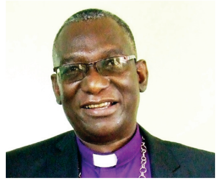
Mkuu wa KKKT, Askofu Dkt. Fredrick Onael Shoo.

Pamoja na vituo vya Kazi za Umoja, Dayosisi zina hospitali 23 na zahanati / vituo vya afya 150. Dayosisi zote zina shule za msingi, sekondari na vyuo vya ufundi na maarifa mbalimbali. Baadhi