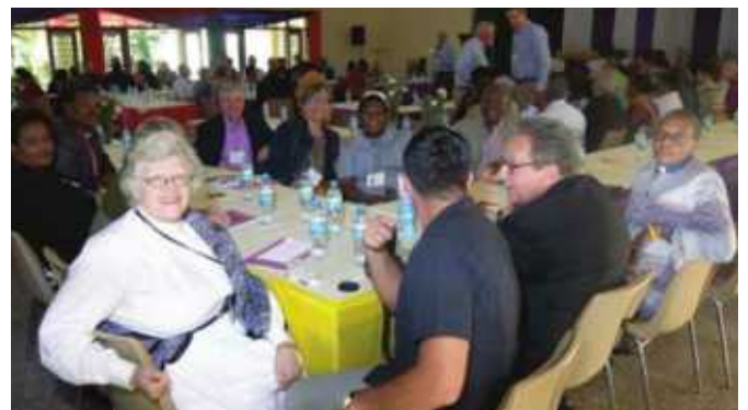
Pichani juu na hapo chini ni baadhi ya washiriki wa Mkutano wa Maaskofu wakijiandaa kwa majadiliano katika vikundi.