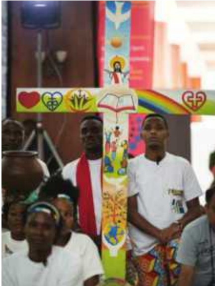
Wito wa kuenenda kwa Roho ni kukubali kuubeba msalaba pamoja na Bwana Yesu.

Ufuasi ni zawadi na wito wa kushirikiana na Mungu ili kubadilisha ulimwengu. Katika kile ambacho wanatheolojia wa awali walikiita “imani ya utakatifu