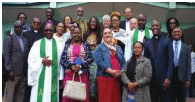
Wajumbe wa Mkutano walipohudhuria ibada Usharika wa Kathedrali ya KKKT, mjini Moshi, tarehe 12 Agosti, 2018.