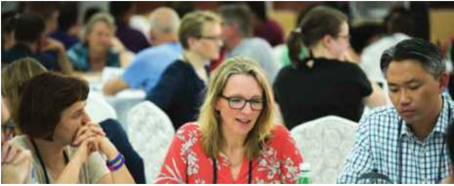
Makanisa na jumuiya za kiekumene zijipime na kuondoa chembe za ubeberu katika mifumo na huduma.