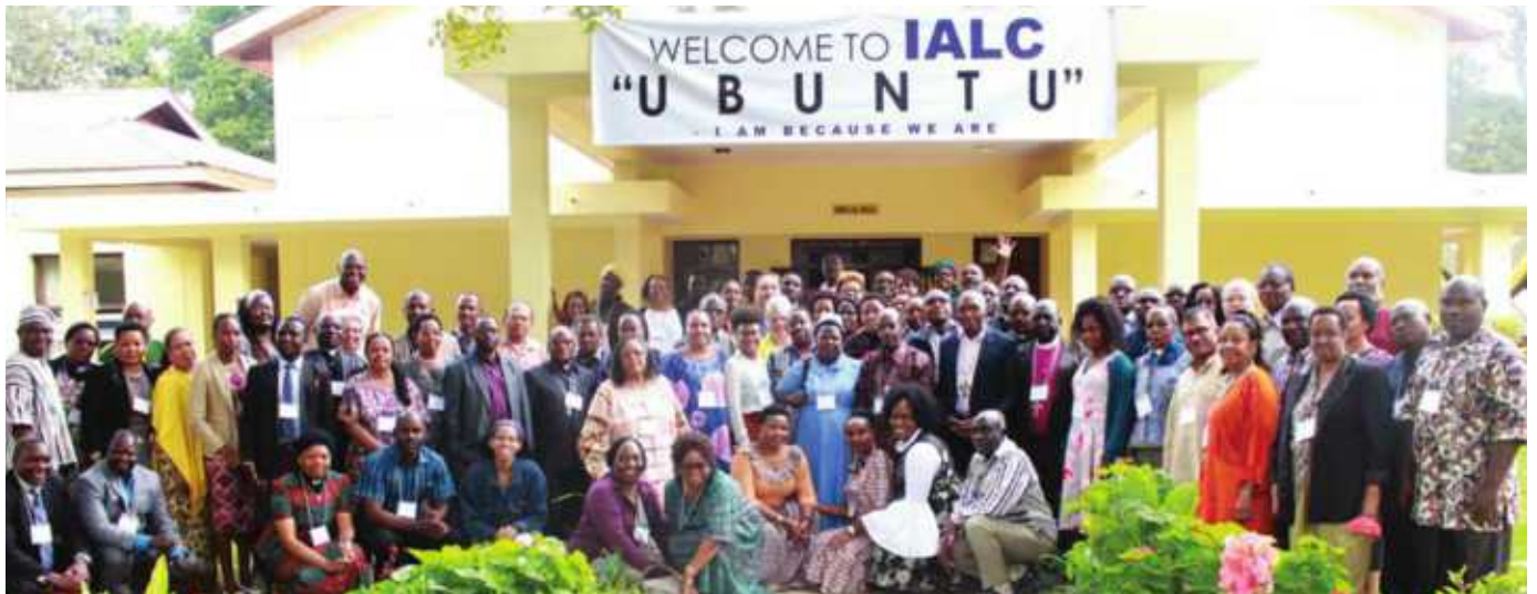
Mkutano wa kwanza wa kimataifa wa Walutheri wenye asili ya Afrika (IALC) ulifanyika 9 - 13 Agosti 2018 katika Hotel ya Uhuru mjini Moshi, Kilimanjaro. Mkutano huo ulihudhuriwa na washiriki kutoka Marekani na Tanzania. Viongozi wa KKKT walikuwa ni miongoni mwa washiriki 95 waliohudhuria.