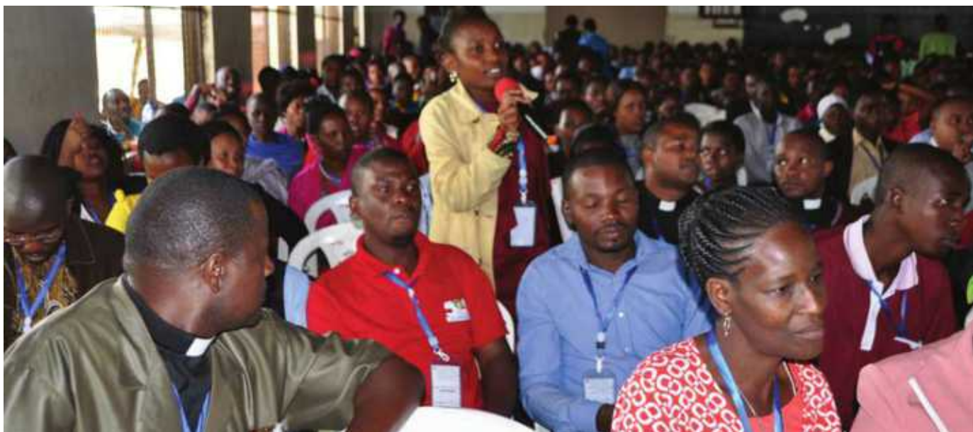
Baadhi ya vijana 1,000 walio Shiriki Kongamano la Vijana wa KKKT lililofanyika Shinyanga.

mbiu: “Wajibu wa Kijana Mkristo na Matengenezo ya Kanisa.” Neno kuu lilikuwa: “Tazama, sisi tumeviacha vitu vyetu vyote na kukufuata” (Lk 18: 28b).