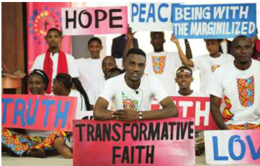
Imani inayobadilisha ni chanzo cha matumaini, haki, amani, upendo na kusimamia ukweli bila ubaguzi.