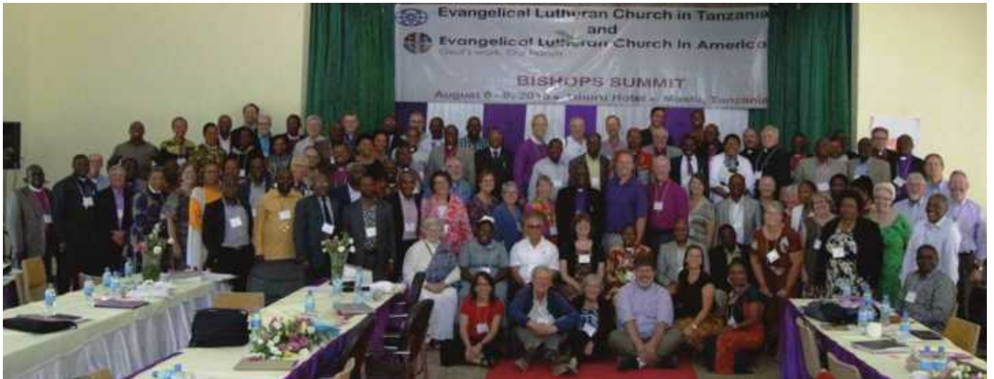
Picha za viongozi wa Kanisa la Kiinjili la Kilutheri Marekani na wa Kanisa la Kiinjili la Kilutheri Tanzania waliokutana Moshi 6 - 9 Agosti, 2018.