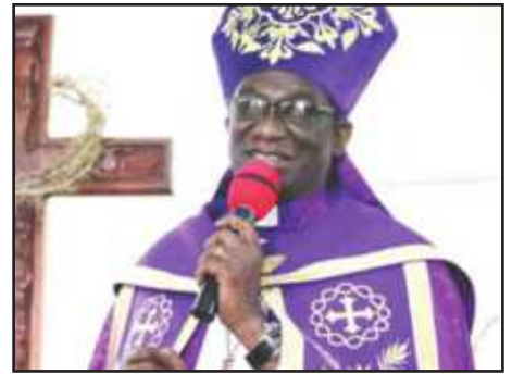
Mkuu wa KKKT, Askofu Dkt. Fredrick Onael Shoo.

Pamoja na vituo vya Kazi za Umoja, Dayosisi zina hospitali 23 na zahanati / vituo vya afya 150. Dayosisi zote zina shule za msingi, sekondari na vyuo vya ufundi na maarifa mbalimbali. Baadhi