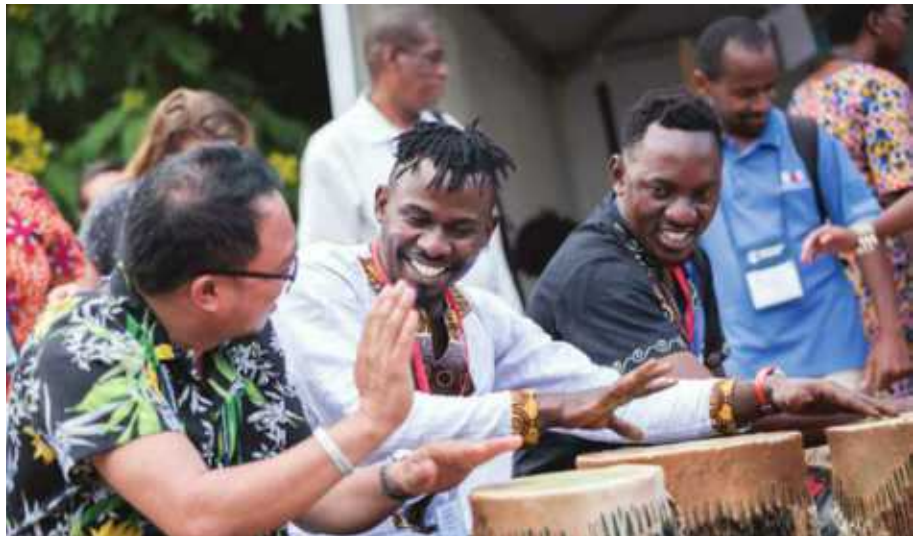
Vijana walibadilishana mawazo na wakufunzi wao kuhusu njia mbalimbali za kuwashirikisha vizuri na kwa ufanisi zaidi vijana ili watoe huduma makanisani kwao hasa katika kufanya kazi za misioni.