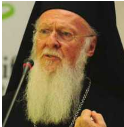
Mkuu wa Kanisa la Orthodox la Magharibi, Papa Bartholomew I.

Katika salamu zake Askofu Mkuu Justin Welby wa Kanisa Kuu la Anglikana la Canterbury, Uingereza alisema tuungane na mitume wa kwanza ambao kwa kukubali utume wao walisema “ufalme wako uje duniani.”