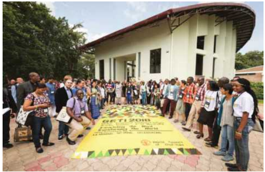
GETI ilitoa fursa kwa vijana kujifunza mijadala kuhusu masuala ya misioni na umoja kiekumene duniani.