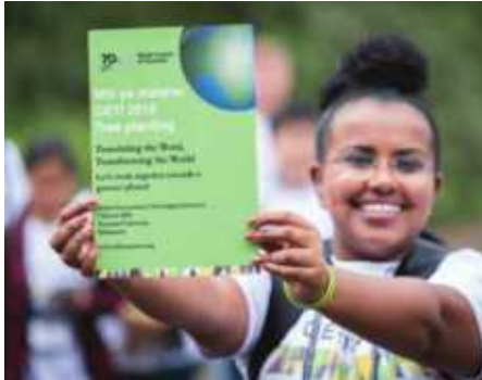
Kama ishara ya kuendeleza uhai na huduma duniani, washiriki wa GETI walipanda miti Chuo Kikuu cha Tumaini Makumira.

Vikundi mbalimbali vilikutana kabla ya Mkutano wa Dunia wa Misioni na Uinjilisti na kimoja kilikuwa cha vijana 120 wakiwemo wanafunzi wa theolojia na elimu ya dini; watafiti wa umoja kiekumene; na wachungaji chini ya mwavuli wa 'GETI'. Huo ni ufupisho wa maneno 'Global Ecumenical Theology Institute'. Lengo la GETI ni kuhimiza na kuandaa vijana watakaokuwa watumishi au viongozi wa kazi ya misioni siku