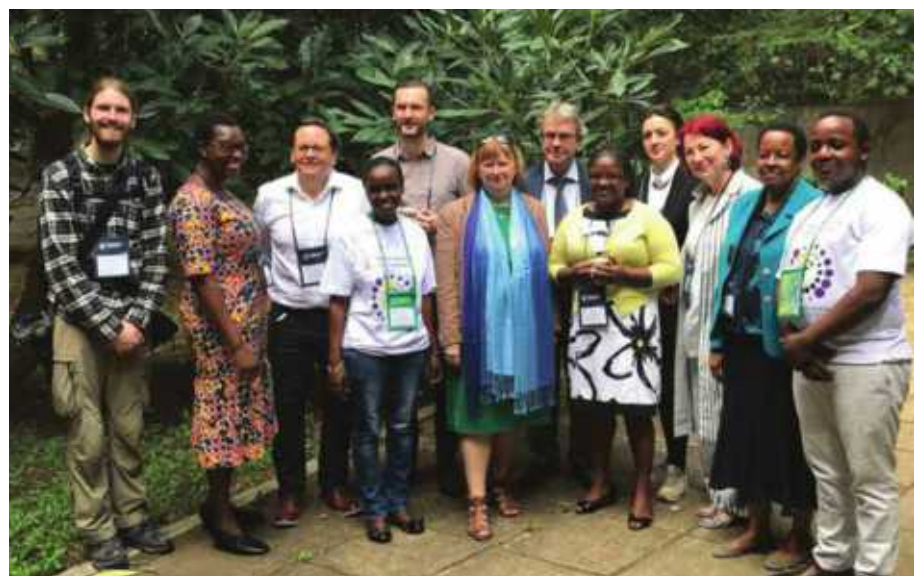
Mkutano wa Dunia wa Misioni na Uinjilisti ulikuwa na timu ya waandishi wa habari toka nchi mbalimbali.