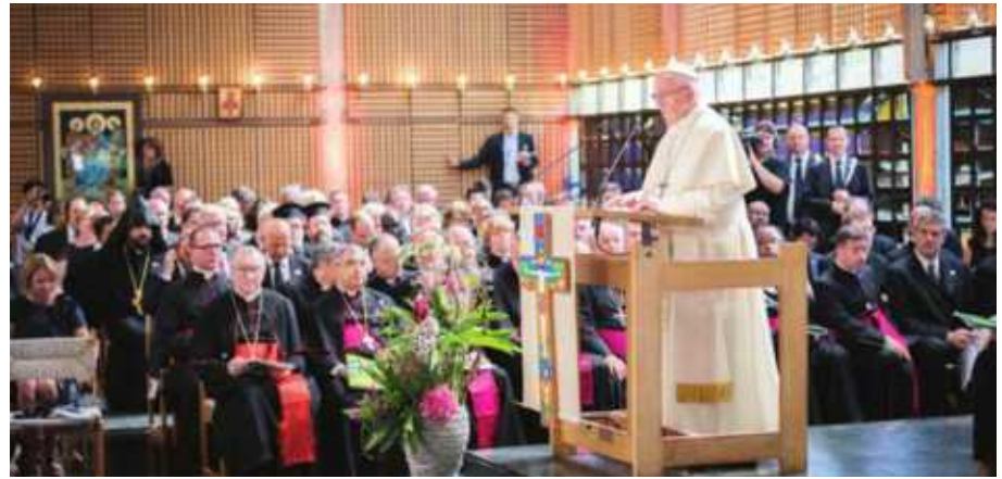
Papa Francis alihutubia viongozi wa dini wakiwemo wajumbe 150 wa Kamati Kuu ya WCC alipofanya ziara Baraza la Mekanisa Duniani (WCC), Geneva, Uswisi.

“Tofauti zetu zisiwe kisingizio cha kutoshirikiana kwa kuwa hata sasa tunaweza kutembea pamoja katika Roho tukisali, kueneza Injili na kuhudumia watu kwa pamoja,” Papa Francis alisema.