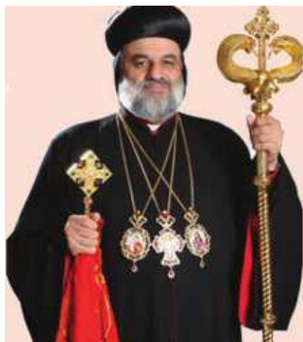
Mkuu wa Kanisa la Orthodox la Mashariki na Mkuu wa Kanisa la Syria, Papa Nor Ignatus Aphrem II.

Alitoa mifano jinsi watu wa Syria wanaoishi maeneo yaliyotekwa na magaidi wanavyoteseka. Alisema ili kuwapa matumaini watu hao anaalika jumuiya ya kimataifa kuunga mkono juhudi za makanisa ya Syria kusaidia walioathirika na vita vya wenyewe kwa wenyewe nchini humo.